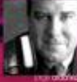
john de borchgrave